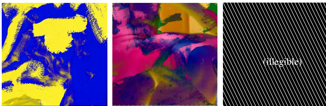
P. Staff. Juegos de impacto , 2023. Stills.

En Juegos de impacto , P. Staff establece un paralelismo entre algunos de los recursos visuales de estas películas y las técnicas clínicas para la visualización del cuerpo: resonancias magnéticas, ultrasonidos, rayos X. Para el equipo curatorial, «se trata de imágenes ópticamente potenciadas que profundizan la medicalización del cuerpo a la vez que ponen de manifiesto contrastes en textura, densidad y temperatura humanas que revelan lo somático como un lugar de variación integral». Así, los quemados y manchas de color que se asocian a la película como soporte físico aparecen superpuestos en piel humana enfatizando la permeabilidad de los cuerpos. Estos efectos visuales son interrumpidos por representaciones de extrañas fisonomías que el espectador tan solo puede intuir. Todo ello se completa con un poema entrecortado que nombra diferentes partes del cuerpo y formas de contacto corporal y que se va acelerando hasta imposibilitar su lectura.